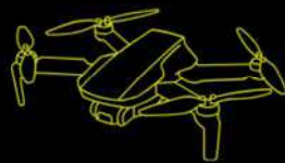
DJI PHANTOM 4