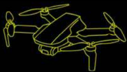
DJI MINI 4 PRO

El programa cuenta con una flota de drones profesionales de última generación y una completa dotación de sensores para garantizar una formación práctica de máximo nivel