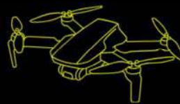
DJI MATRICE 4T